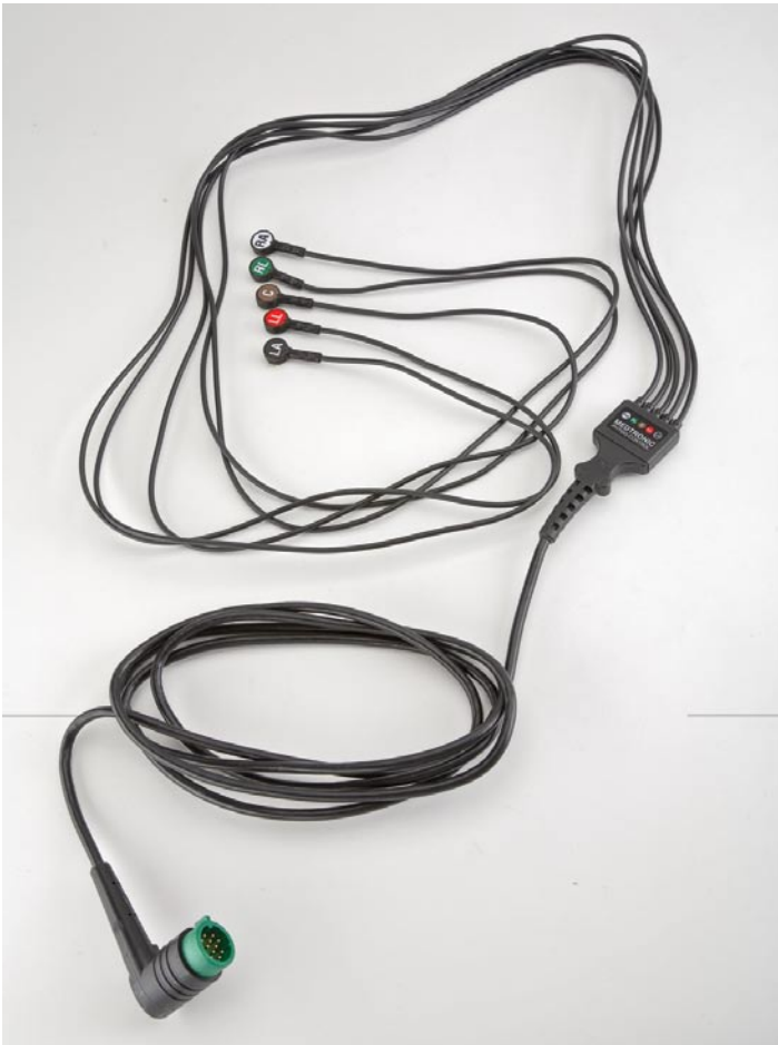
Przewód EKG - 5 żył

Wtyczka prawoskrętna. Wiązka 4 żył plus 1 odprowadzenie przedsercowe "V1".