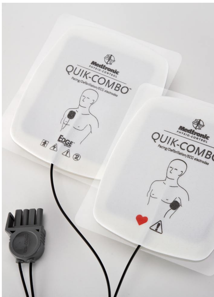
Elektrody EDGE System ze złączem QUIK-COMBO ...11996-000091