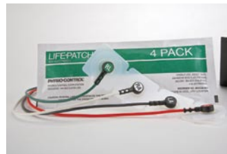
Elektrody EKG LIFE•PATCH®

Dla dorosłych, wstępnie żelowane. W opakowaniu 4 elektrody.