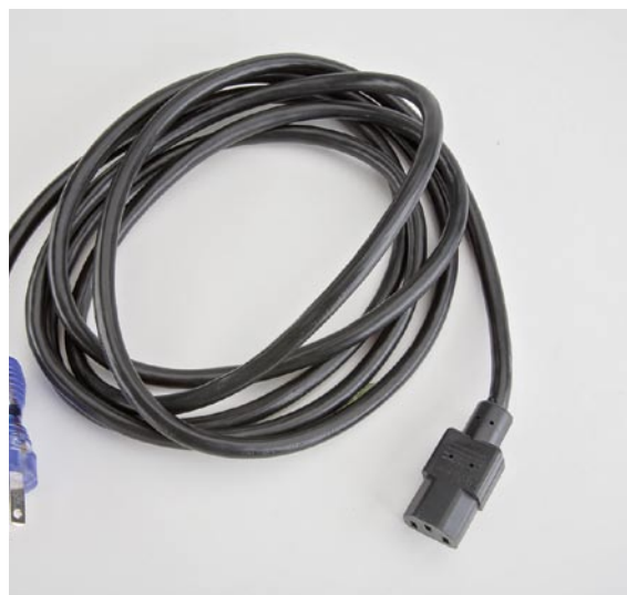
Przewód zasilający AC

Doładowywany akumulator niklowo-manganowo-wodorkowy. Napięcie 12V. Do ładowania z sieci AC..... 11141-00068