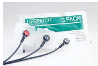
Elektrody EKG LIFE•PATCH®

Dla dorosłych, wstępnie żelowane. W opakowaniu 3 elektrody.