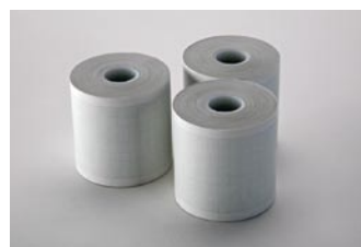
Papier EKG (wąski)