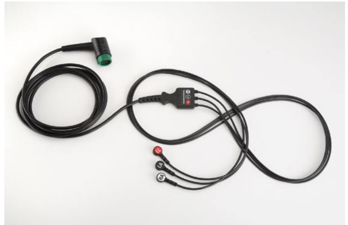
Przewód EKG 3 - żyły