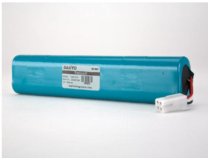
Akumulator wewnętrzny NiMH

W przypadku pytań lub wątpliwości prosimy o kontakt z lokalnym przedstawicielem Physio-Control.